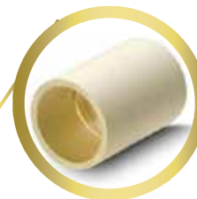
Cople 1/2" y 3/4"