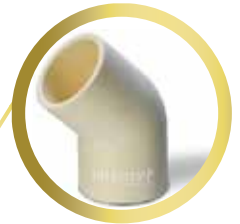
Codo 45 1/2" y 3/4"