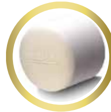
Tapa Hembra 1/2" y 3/4"