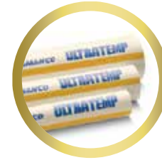
Tubería 1/2" y 3/4"