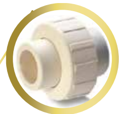
Tuerca Unión 1/2" y 3/4"