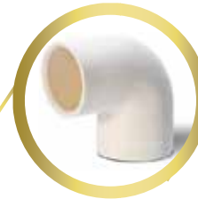
Codo 90 1/2" y 3/4"