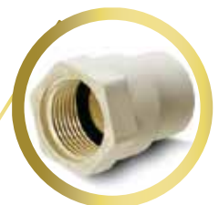
Adaptador Hembra 1/2" y 3/4"