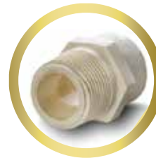
Adaptador Macho 1/2" y 3/4"