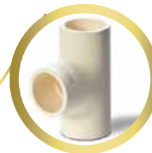
Tee 1/2" y 3/4"